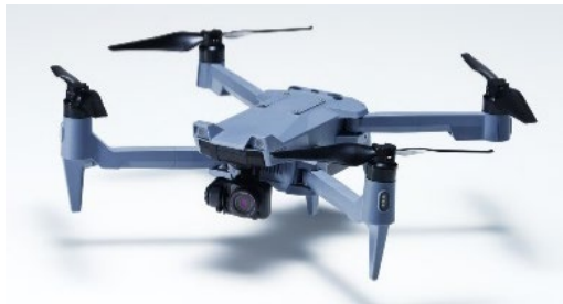
蒼天(SOTEN) (株式会社 ACSL)