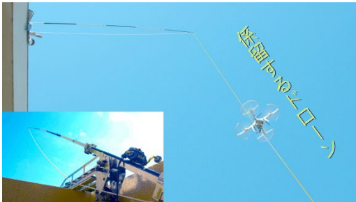
ラインドローンシステム (西武建設株式会社)